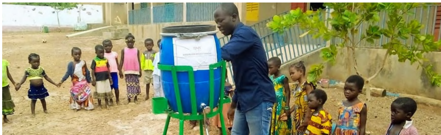
CARTA DE LA DIRECTORA GENERAL

Conciencia Vocación Educación Desarrollo Profesionalidad Sostenibilidad Compromiso Transparencia