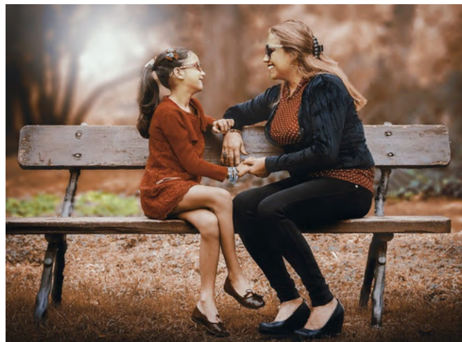
Cursos gratuitos para gestionar emociones en el confinamiento con educación en positivo

En estas breves formaciones se abordaron preocupaciones y problemas familiares y la forma de aprender a gestionar sin gritos, enfados constantes ni agotamiento mental, para llevar esta situación lo mejor posible.■