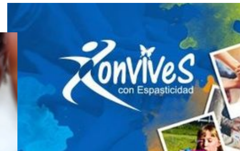
Conocer la espasticidad