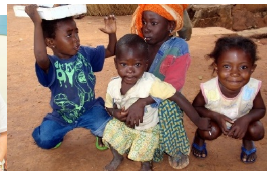
Educación en Burkina Faso