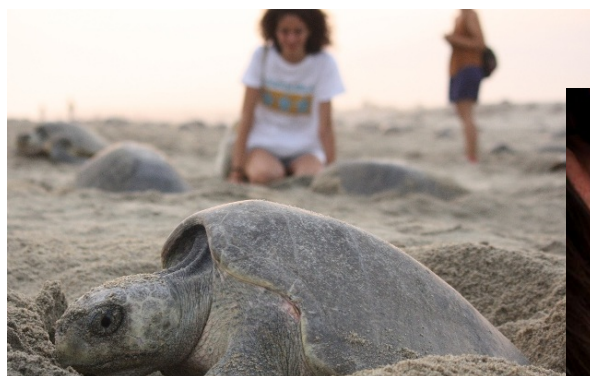
Respeto a la Naturaleza