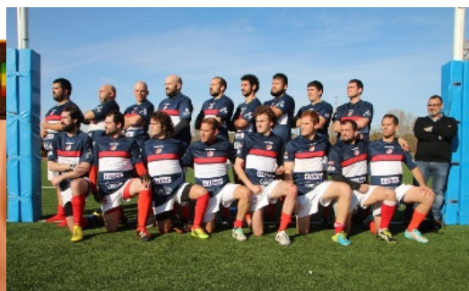
Rugby con valores