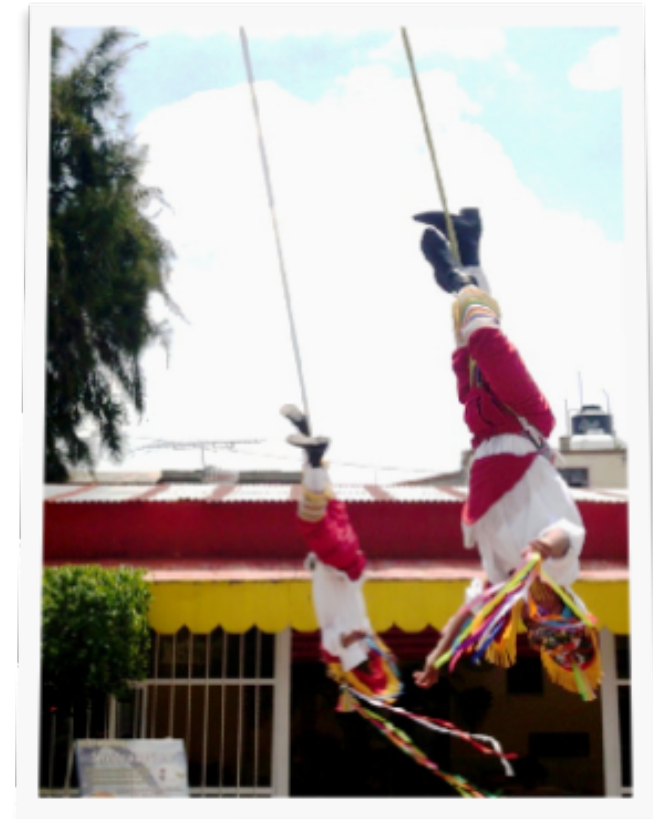
Danza de los voladores de Papantla (Veracruz, México)

“Comunicar implica transparencia y esto genera confianza y lealtades duraderas”