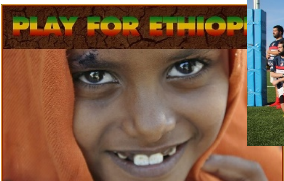
Agua y Salud en Etiopía