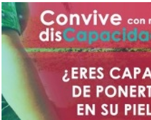
DDHH y Discapacidad